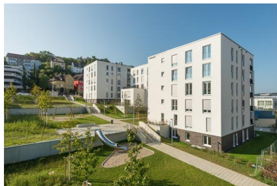
Grünanlage + Spielplatz