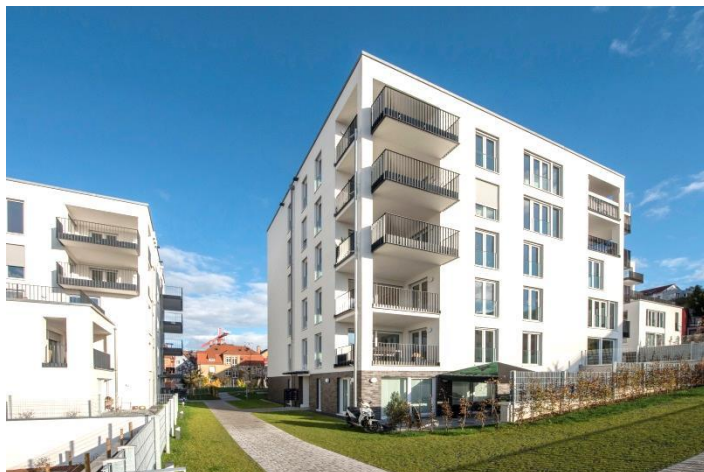
Ansicht Haus 2 + 3