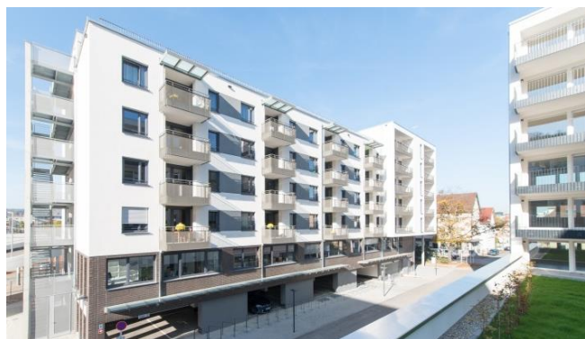
Ansicht Haus 5