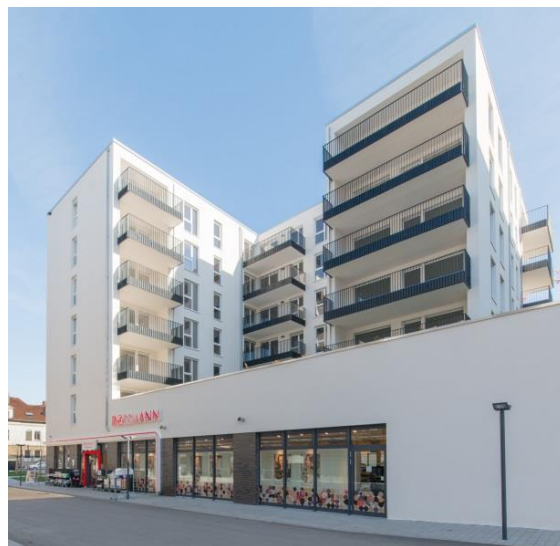
Ansicht Haus 4

In drei Punkthäusern wurden im ersten Bauabschnitt 39 Eigentumswohnungen errichtet, im Haus vier 24 Mietwohnungen und ein Drogeriemarkt und im Haus fünf 55 betreute Seniorenwohnungen sowie eine Büroeinheit.