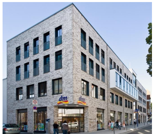
Ansicht Bauteil 2 – Einzelhandel + Praxen + Wohnungen