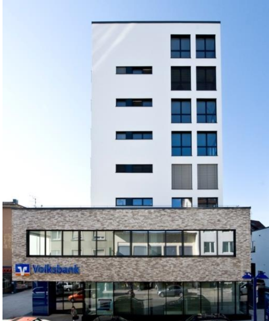
Ansicht Bauteil 1 – Bank + Wohnungen

Die örtliche Einkaufsmeile von Stuttgart-Feuerbach sollte an zentraler Stelle aufgewertet werden. Bis dato stehen hier Flachdachbauten neben älteren Satteldach-Gebäuden, grauer Sichtbeton wechselt mit Altbauten.